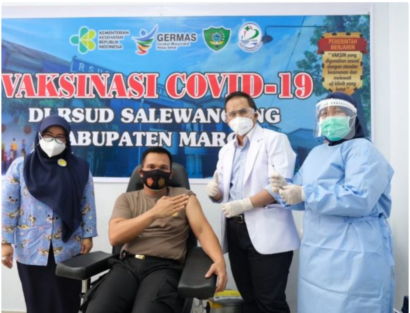
Dukung Program Vaksinasi Pemerintah Pusat, seluruh Personil Polres Maros Siap Divaksin